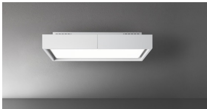
Fotografiet er udelukkende informativt Korresponderer ikke nødvendigvis tmed den valgte model