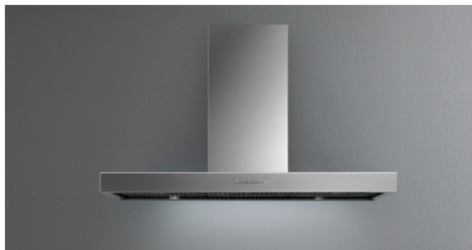
Fotografiet er udelukkende informativt Korresponderer ikke nødvendigvis tmed den valgte model