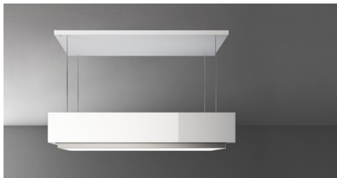
Fotografiet er udelukkende informativt Korresponderer ikke nødvendigvis tmed den valgte model